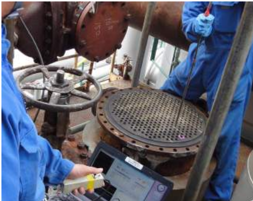
熱交換器伝熱管への FTECT 適用状況

本件では、この渦電流探傷試験の中でも、ボイラーなどの熱交換器等の強磁性伝熱管を対象とする検査技術として同社が特許を保有する検査技術『強磁性チューブ渦電流探傷技術（FTECT：エフテクト）』に AI を適用しています。具体的には、FTECT によって取得された検査データの解析作業に AI を適用し、データ上に現れる減肉信号を自動抽出することを目指したものです。 *2